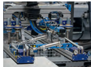
Produktionsräume der Firma erfi – Industrie 4.0 mit Homag-Maschinen